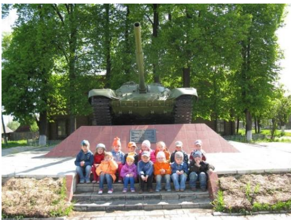
Экскурсии к достопримечательностям нашего города