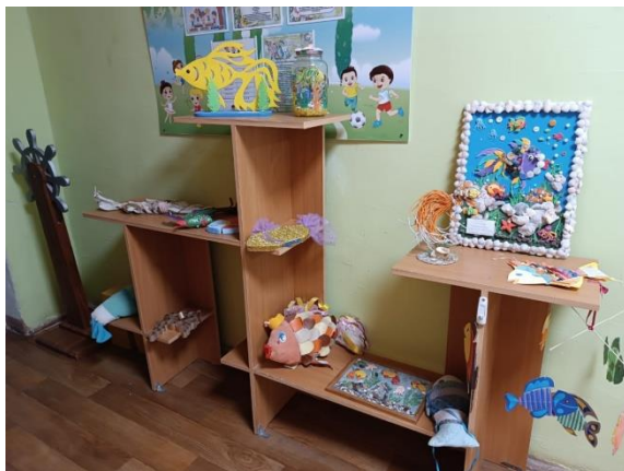
Мини-музей «Рыба моей мечты»