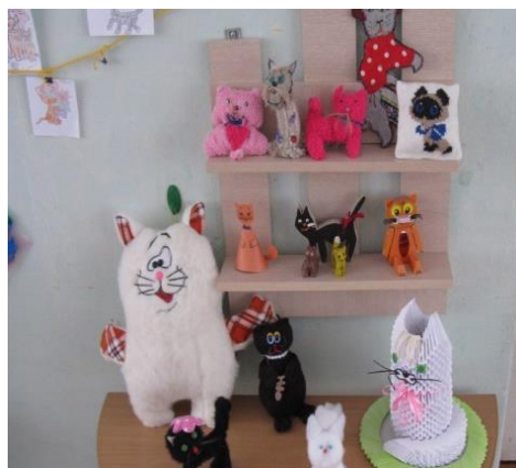
Мини-музей «Любимые кошки»