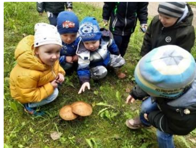
Экскурсии в природу