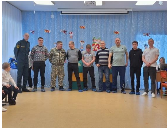
День защитника Отечества