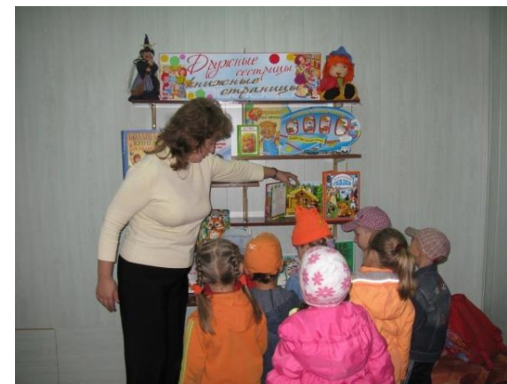
Мини-музей «Детская книжка»