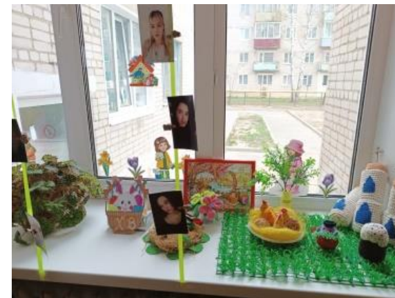
Мини-музей «Пасхальный сувенир»