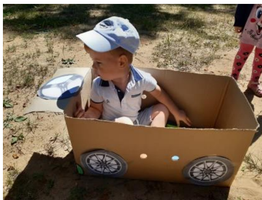
Чудеса из коробок