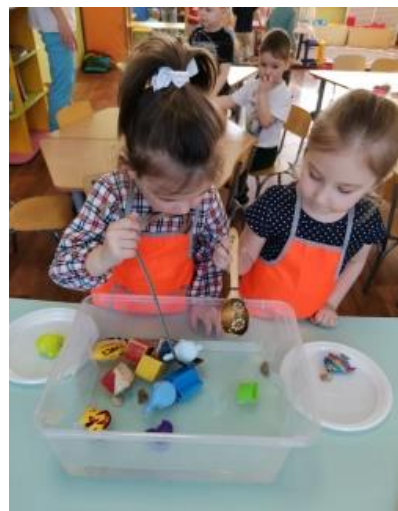
Играем с водой