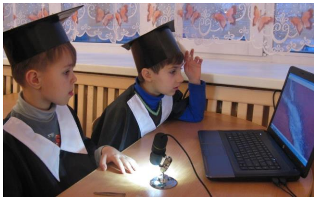
В научной лаборатории