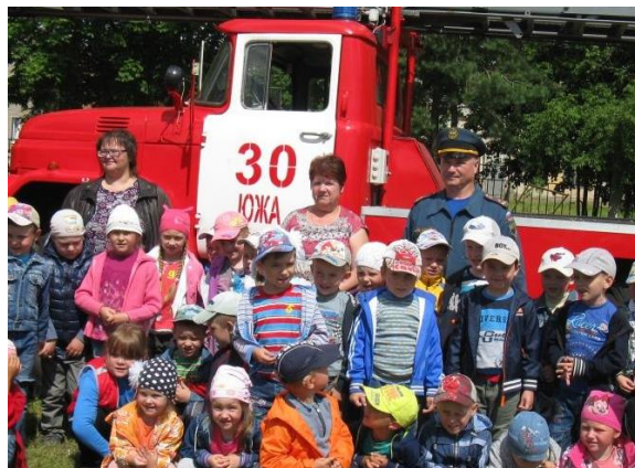
Экскурсия в пожарную часть