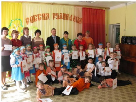
Смотр художественной самодельности