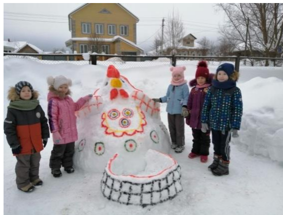
Красота на участке