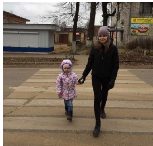
Акция «Я — пешеход»