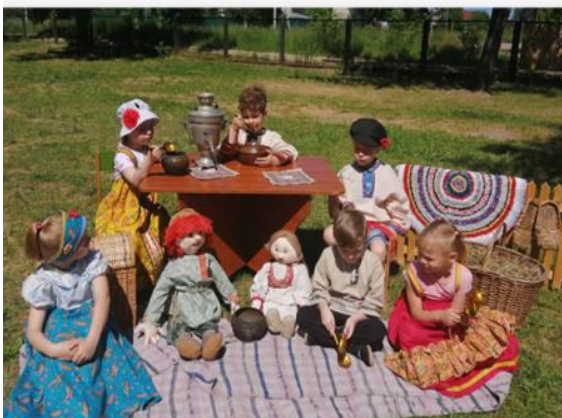
В «Уголке русского быта»