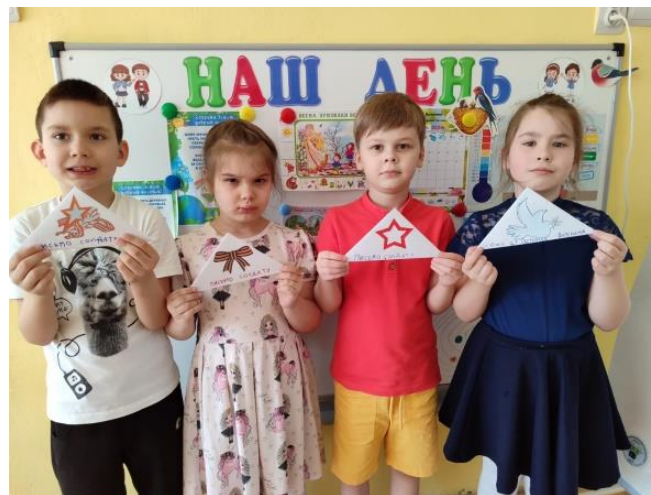
Акция «Письмо солдату»