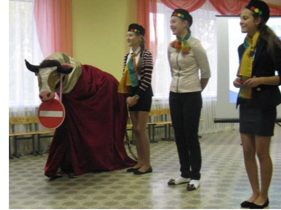
Юные инспекторы дорожного движения