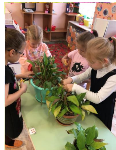
В уголке природы