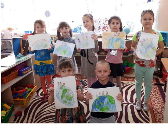
Конкурс «Земля — наш общий дом»