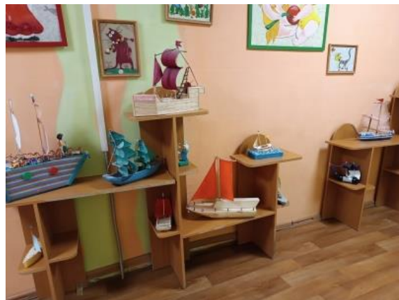
Мини-музей «Русская флотилия»