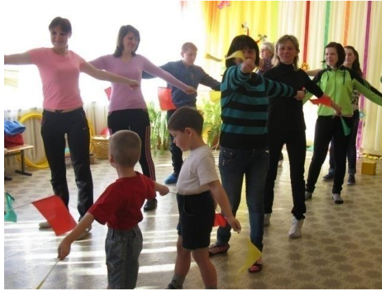
Неделя открытых дверей