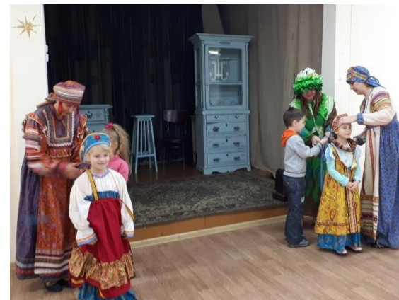
Праздник в «Доме ремесел»