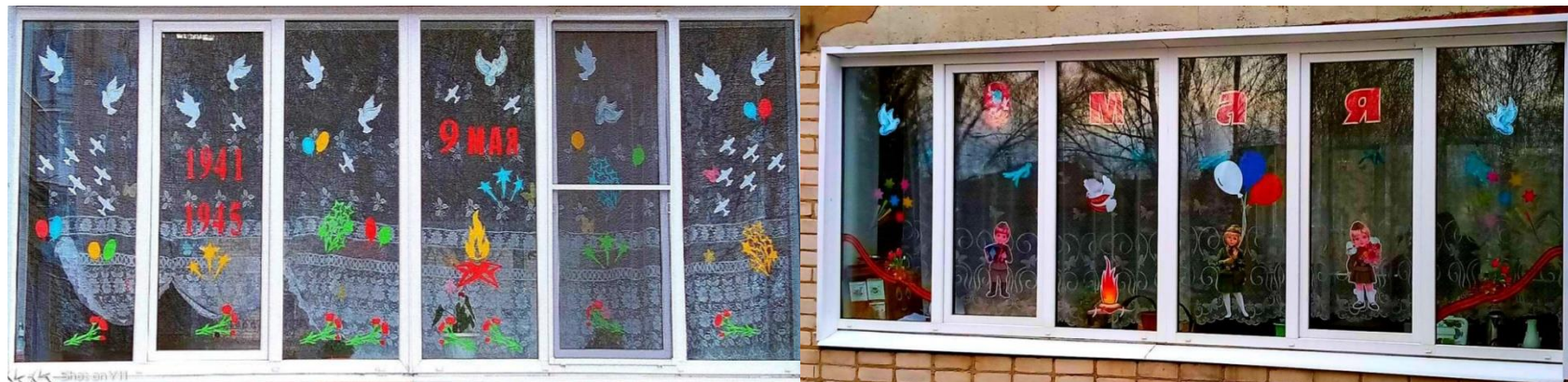
Акция «Окна Победы»