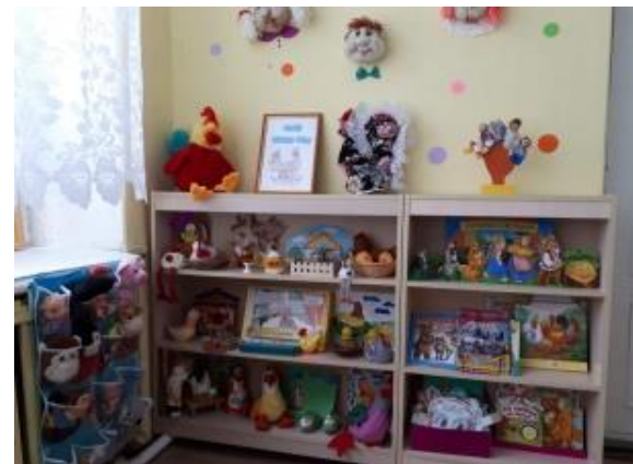
Проект «Любимые сказки»