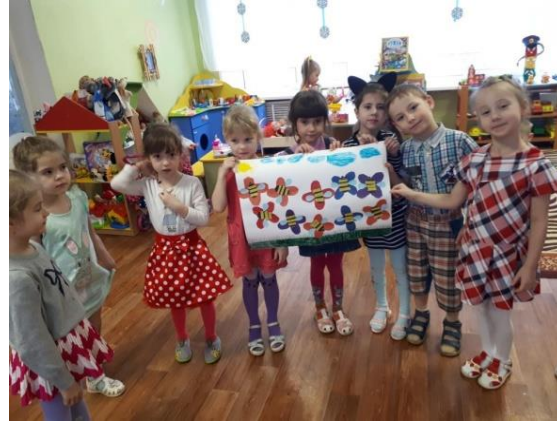
Выставка детских работ «Веселые пчелки»