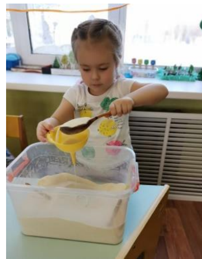
Игры с манкой