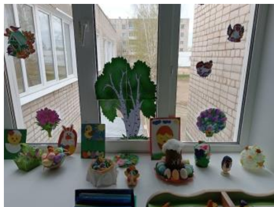
Мини-музей «Пасхальный сувенир»