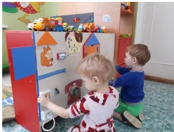
Праздник «Мамин день»