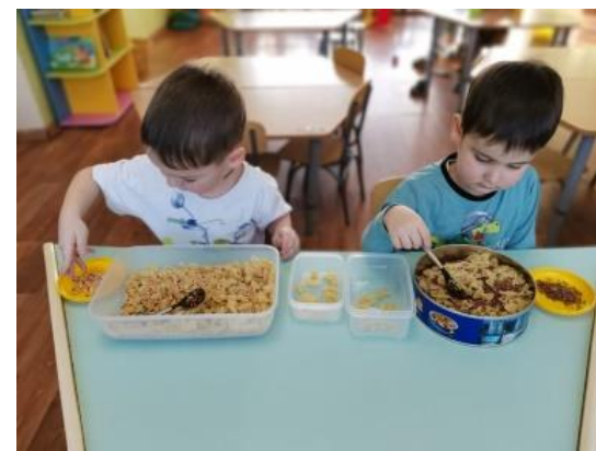
Игры изо всего