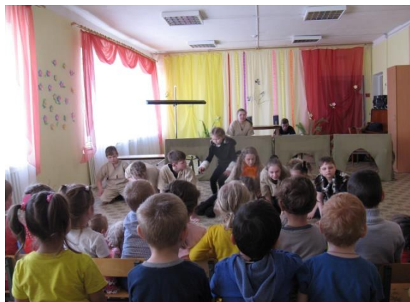
Южский детский театр «Театрина»