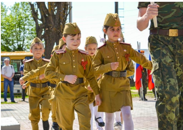
На «Параде дошколят»